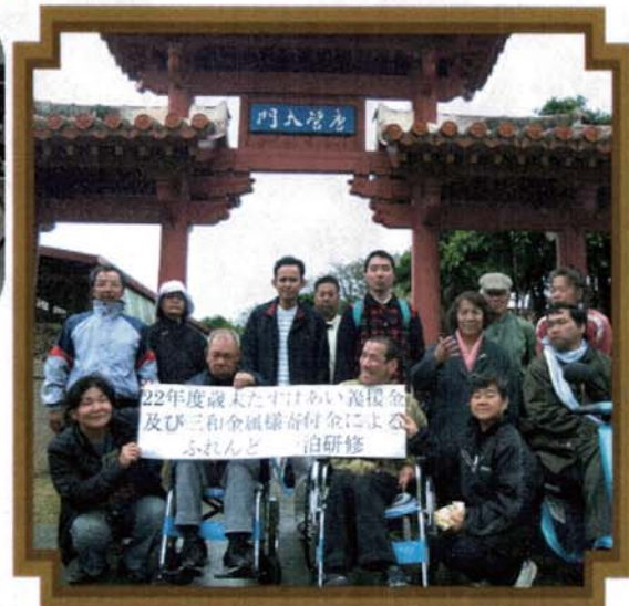
22年度歳末たすけあい共同募金 及び三和金属様寄付金による公 ふれんど一泊研修