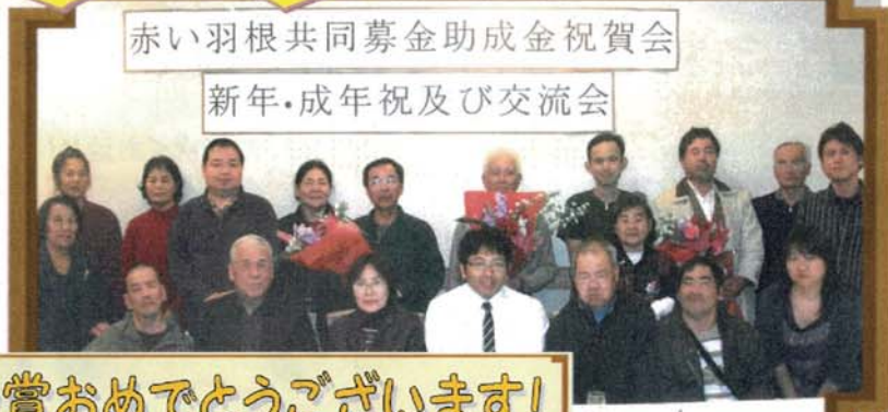
赤い羽根共同募金助成金祝賀会 新年・成年祝及び交流会