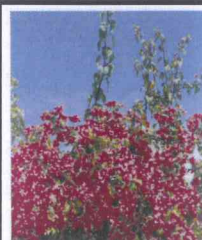
那覇市花/ブーゲンビレア