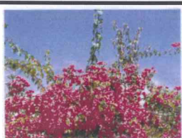
那覇市花/ブーゲンビレア