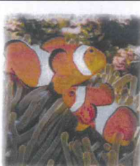
イソギンチャクとクマノミ