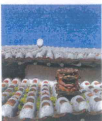
壺屋/東窯 (アガリスガマ)