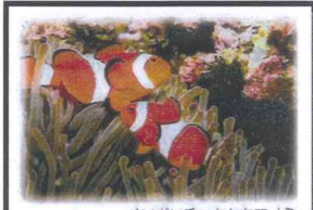
イソギンチャクとクマノミ