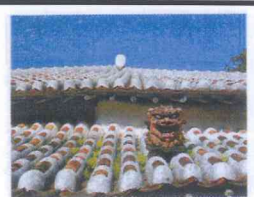
壺屋/東窯 (アガリスガマ)